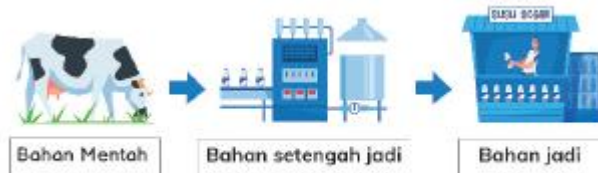
Gambar 7.1 Proses produksi pada susu cair

Proses kegiatan produksi memiliki 3 tahapan: