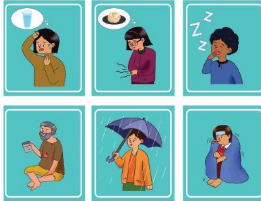
Lampiran 7.1 Kartu Kebutuhan Manusia