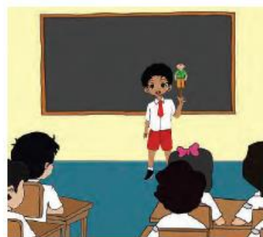
Gambar 5.1 Permainan Kartu Wayang Tokoh

2) Alternatif Pembelajaran 2, guru dapat melaksanakan kegiatan pembelajaran dengan mendesain berbagai aktivitas pekerjaan di lingkungan keluarga dan gambar tokoh yang ada pada aktivitas tersebut. Peserta didik diminta mengaitkan aktivitas anggota keluarga menggunakan wayang orang dan kartu atribut pekerjaan. Kemudian peserta didik diminta untuk bercerita mengenai gambar wayang orang dan kartu atribut pekerjaan rumah (Media Kartu dan Wayang Tokoh).