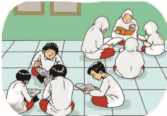
Gambar 6.2 Peserta didik kelas 4 sedang melakukan tadarus Al-Qur'an

Sudahkah kalian mengaji Al-Qur'an hari ini? Ceritakan pengalamanmu mengaji di rumah! Anak-Anak, biasakan belajar mengaji setiap hari. Allah Swt. memberikan penghargaan kepada orang yang belajar Al-Qur'an, walaupun membacanya masih terbata-bata. Rasulullah saw. bersabda: