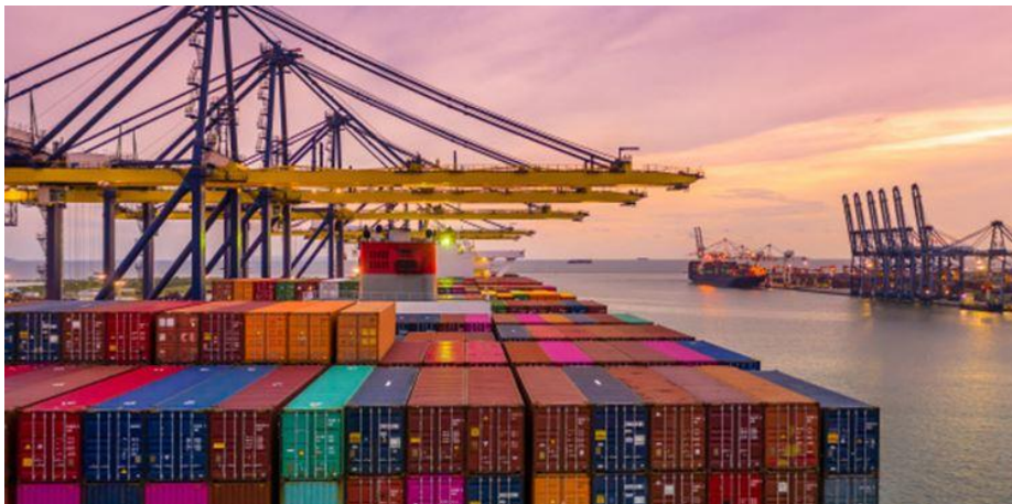
c. Gambar kegiatan ekspor