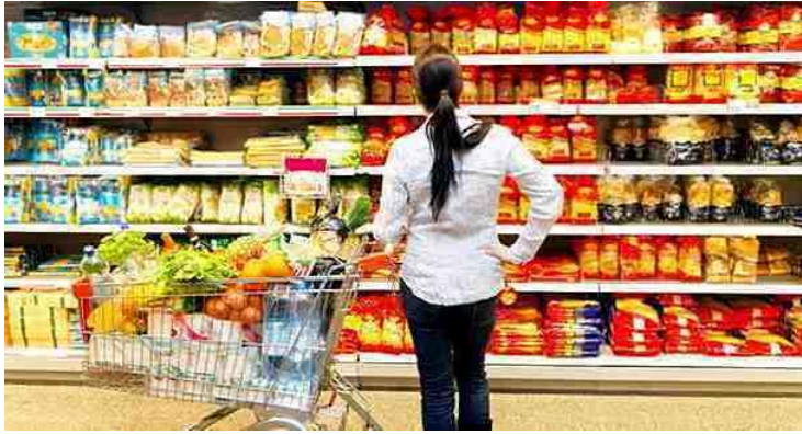
b. Gambar pendistribusian komoditas perdagangan