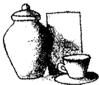
Gambar 1.21 Contoh gambar sudah ada arsir

Jika gambar sudah ada arsir : Sangat Baik (100 – 90)