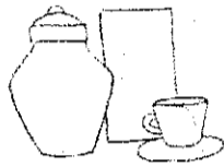
Gambar 1.20 Contoh gambar tahap outline dan bayangan sederhana

Jika gambar pada tahap outline dan bayangan sederhana : Baik (89-80)