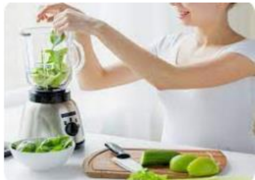
Masukkan buah ke dalam blender