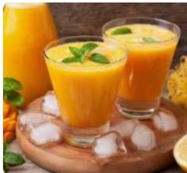
Tuang jus dalam gelas dan siap disajikan