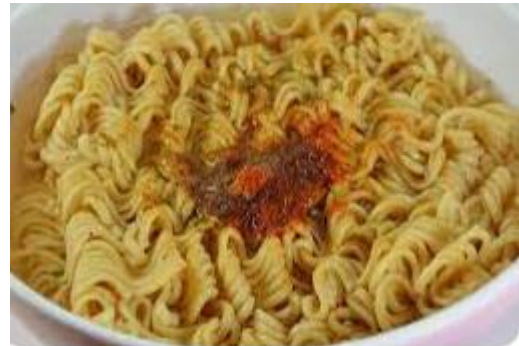
Masukkan bumbu dan aduk merata