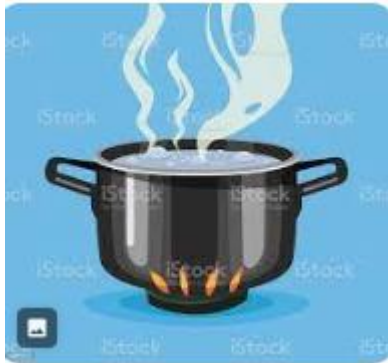
Rebus air hingga mendidih