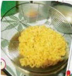
Tiriskan mie instan