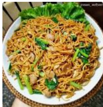
Mie instan siap disajikan