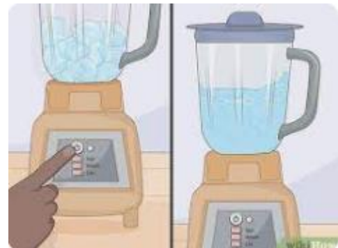
Tekan tombol blender dan tunggu 5 menit