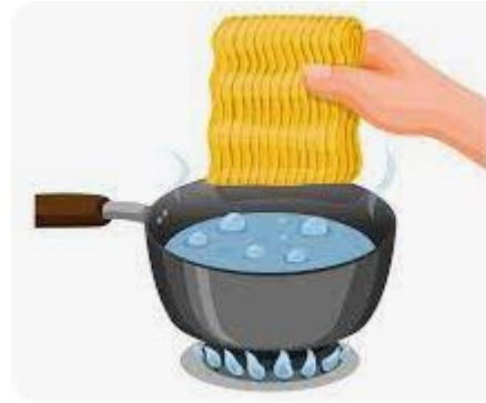
Masukkan mie instan kedalam air mendidih